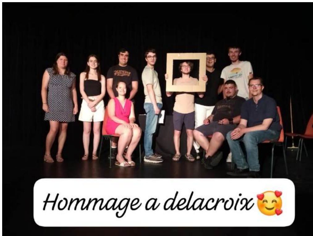
Souvenirs au Musée