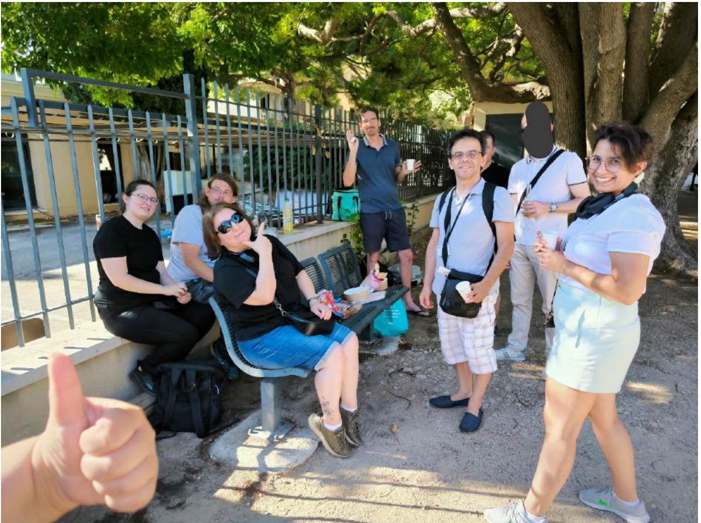
Rencontre délocalisée dans un parc de Six-Fours en Juillet lors de la fermeture de la Maison des familles de Six-Fours.

De 6 à 10 participants se retrouvent tous les mois à la Maison des Familles de Six-Fours, le mercredi de 17h30 à 19h. Pour le bon fonctionnement du groupe, et étant donnée la configuration du lieu, nous ne pouvons pas être trop nombreux.